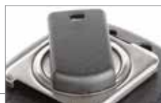
Abnehmbarer, 360° drehbarer Befestigungsclip