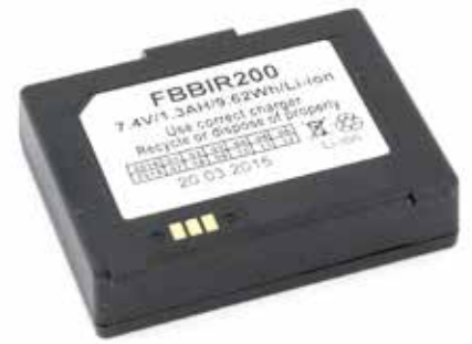
Artikel-Nr.: FBBIR200 Li-Ion Akku für BIXOLON SPP-R200/II, SPP-R300, SPP-R400 mit 7,4V und 1,3 Ah.

Akkus für die mobile Erfassung und Verarbeitung von Daten, beispielsweise bei Verkehrsordnungswidrigkeiten. Für Geräte wie Bixolon, Zebra EM220 und Psion EP10. Akkus für weitere Geräte auf Anfrage.