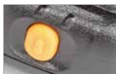
Notruftaste farblich abgesetzt

Ergonomisch geformt, hochwertig verarbeitet