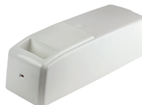
MBU0102 PB-Akku (Zellentausch/Reparaturauftrag) für ARJO Patientenlifter Trixie Sarita Typ KTA0102 , 24,0V/2,0Ah