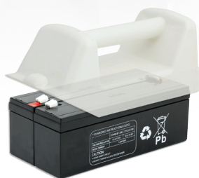
MBU1301 PB-Akku (Zellentausch/Reparaturauftrag) für ARJO Patientenlifter Maximove NDA0100-03 , 24,0V/4,0Ah

Senden Sie uns einfach das Gehäuse des Akkus ein. Wir kümmern uns um alles Weitere. Verbrauchte Zellen tauschen wir gegen neue, hochwertige Industriezellen. Lediglich Gehäuse und Sicherungselemente bleiben erhalten. Sie erhalten Ihren absolut neuwertigen Akku mit Konformitätserklärung und 100% Leistung bei bis zu 60 % Kostenersparnis schnell zurück. Sie schonen dabei zusätzlich die Umwelt, indem Sie Abfall vermeiden und Ressourcen sparen.